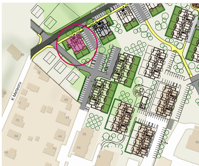
situace BD 16 VILADŮM